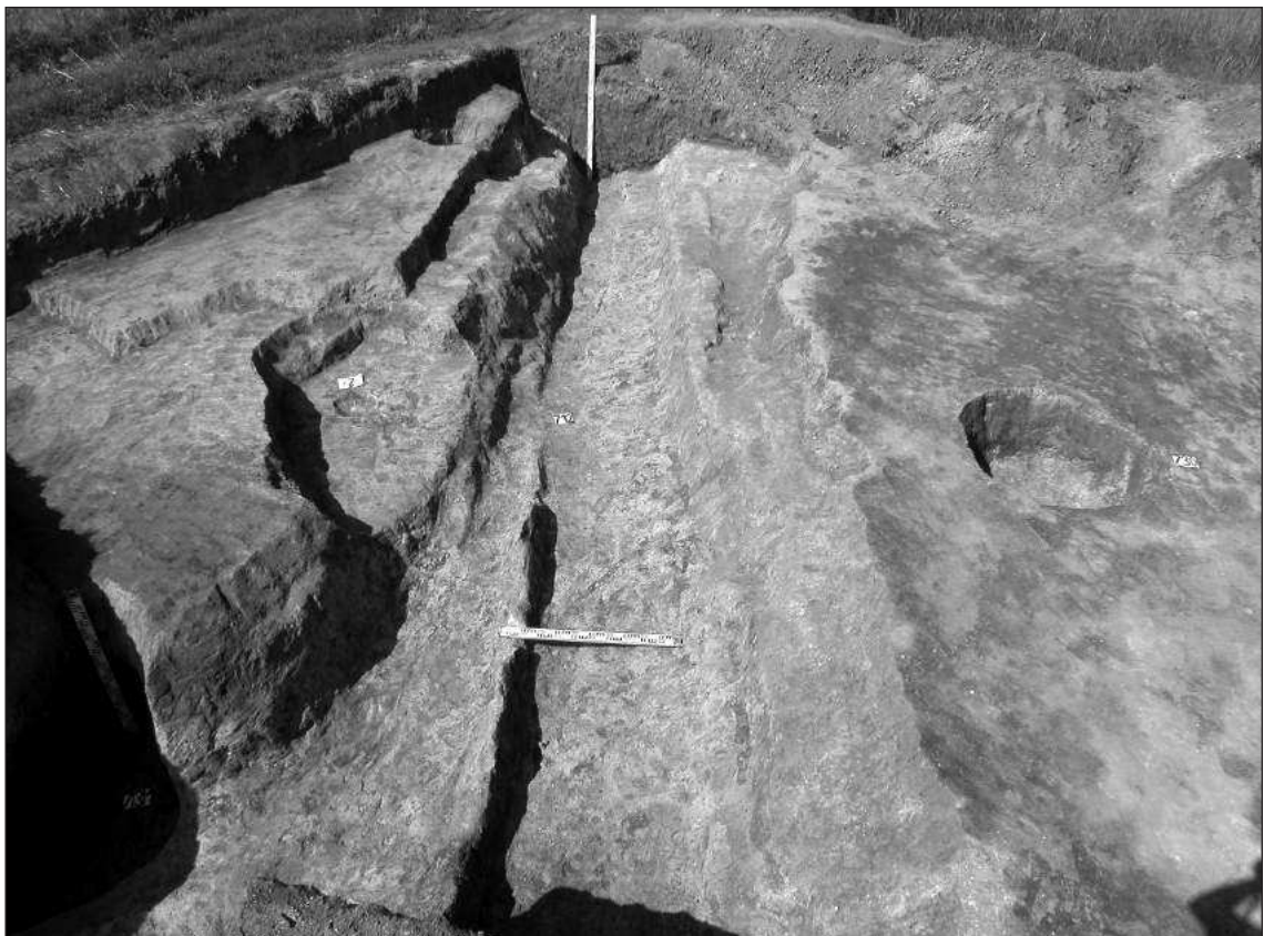
Figure 5 – Section of a foundation trench of the fortification, 10th century

2006. године истраживала екипа Покрајинског завода за заштиту споменика културе у Новом Саду. Судећи по међусобној удаљености ових објеката, читав комплекс не може имати распон мањи од 100 m.