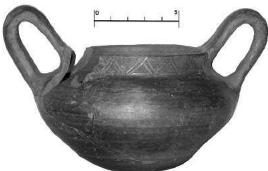
Слика 2 – Двоухи пехар рађен на брзом витлу, I век

Настављено је истраживање рова из X века, започето прошле године (сл. 5). Ров је до сада испраћен у дужини од око 20 м, с тим што се његово пружање у правцу ју-