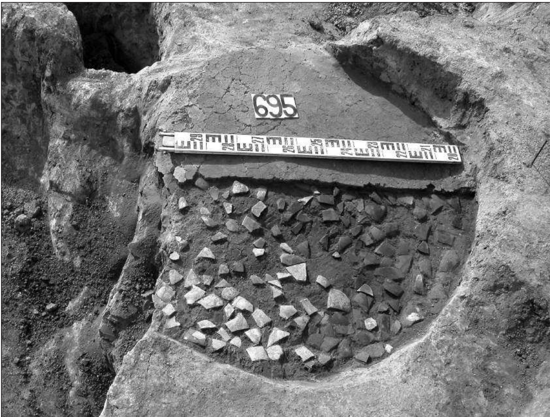
Слика 1 – Кухињска пећ са арматуром од ломљених посуда, I век