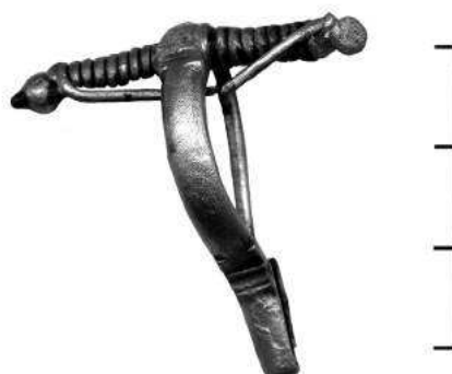
Слика 3 – Сребрна фибула, III-IV век