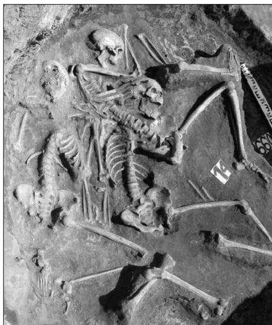
Слика 7 – Група скелета

С обзиром да на овом налазишту и даље ради циглана, биће неопходна даља систематска заштитна археолошка ископавања.