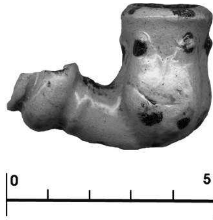
Слика 6 – Глеђосана лула за пушење, XVII-XVIII век

Figure 6 – Glazed tobacco pipe, 17th-18th century